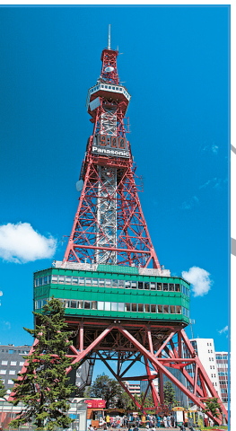
札幌のランドマークである「さっぽろテレビ塔」のカウントダウンで一斉にスタート!