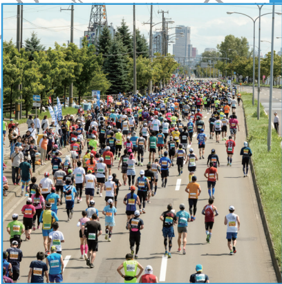
往復13kmの新川通。精神力を試される難所であり、北海道マラソンの名物にもなっている。