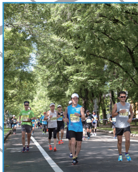
緑のドームに覆われた、北大キャンパス。